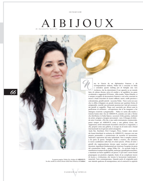
AIBIJOUX International vocation See page 66