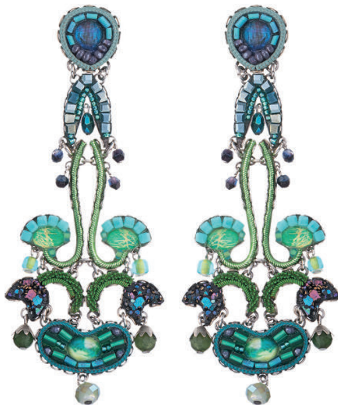
In questa pagina, dall'alto a sinistra in senso orario: orecchini Lucky Charm di Kurshuni, in argento 925 con finitura in oro rosa e cubic zirconia incassati a mano. Bracciale Deva di India19 in argento e pietre naturali; orecchini Green River della collezione Classic di Ayala Bar in metallo con cristalli a mosaico.